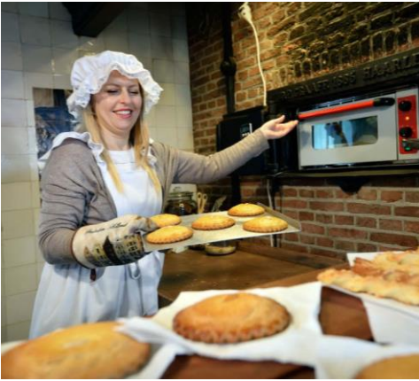
Albert Heijn uit 1887.

Veel van de typische Zaanse houten huisjes in de Zaanse Schans komen uit andere delen van de Zaanstreek en geven een idee hoe de meeste dorpen er in de 18e eeuw uit zagen. Ook zijn er een scheepswerf, klompenmakerij, bakkerijmuseum, kaasmakerij, tinnengieterij en een replica van de eerste kruidenierswinkel van